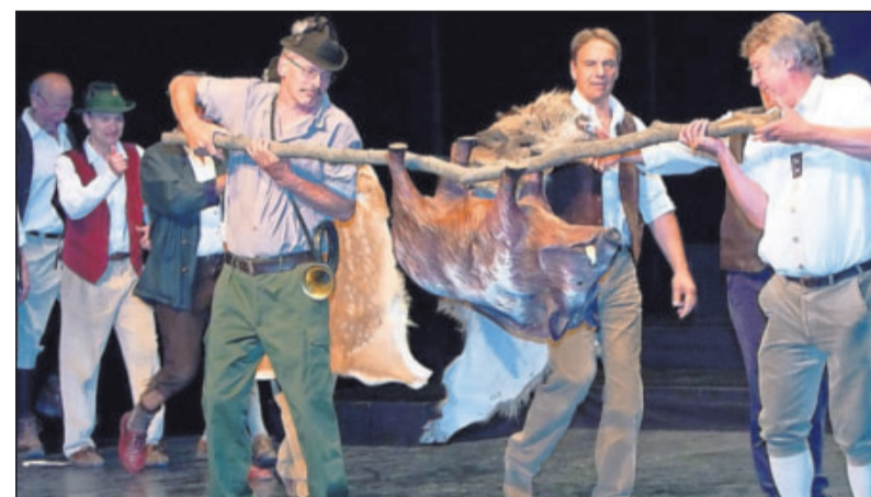
Ein romantisches Opernkonzert mit Ausschnitten aus dem „Freischütz“ und den „Lustigen Weibern von Windsor“ bietet die Neustadter Liedertafel am 29. Mai im Saalbau – da darf auch eine Wildsau nicht fehlen.