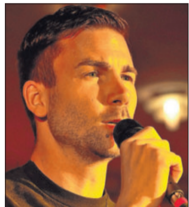
Poetry-Slams gibt's normalerweise nur in Großstädten – am 7. Mai aber auch im kleinen Kirrweiler.