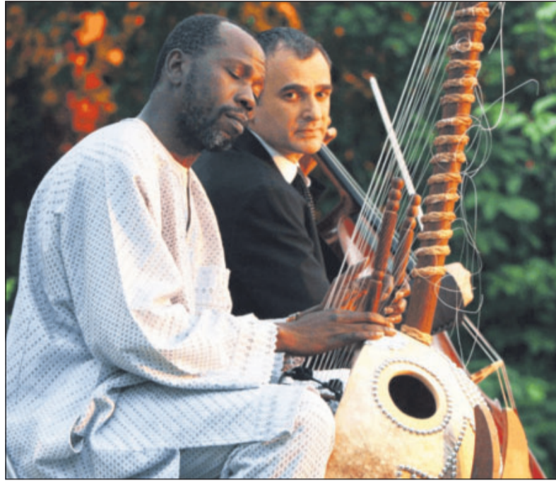
Mit dem leider verregneten Konzert von Ballaké Sissoko und Vincent Segal am 17. Juni gastiert erstmals das Palatia-Jazz-Festival in Neustadt.