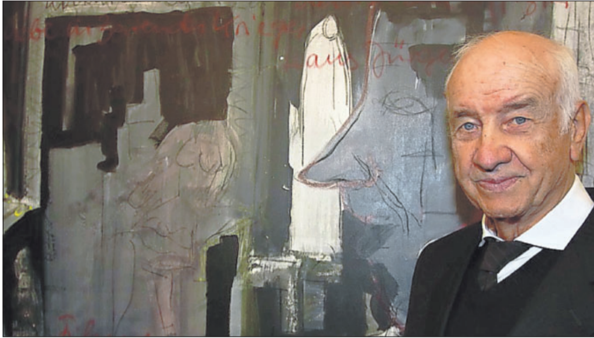
Weltstar in der Villa Böhm: Armin Mueller-Stahl stellt im Oktober/November auf Einladung des Neustadter Kunstvereins Gemälde, Zeichnungen und Lithographien in der Villa Böhm aus.